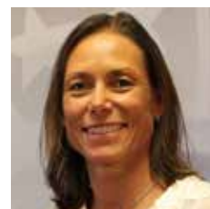
LILL FÜSSEL / TRADING